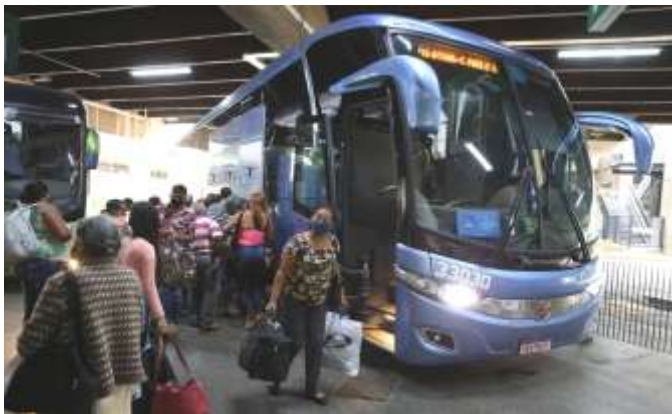
Terminal Rodoviário do Tietê

São Paulo oferece ainda atrações públicas e privadas como mirantes, parques, museus, cinemas, salas de exibição, teatros, feiras e eventos, arte de rua, passeios como o zoológico, Simba Safari, jardim botânico, áreas de proteção ambiental e esportes como: campos de golfe, estádios de futebol, esporte náutico, autódromo, jockey club e kartódromos.