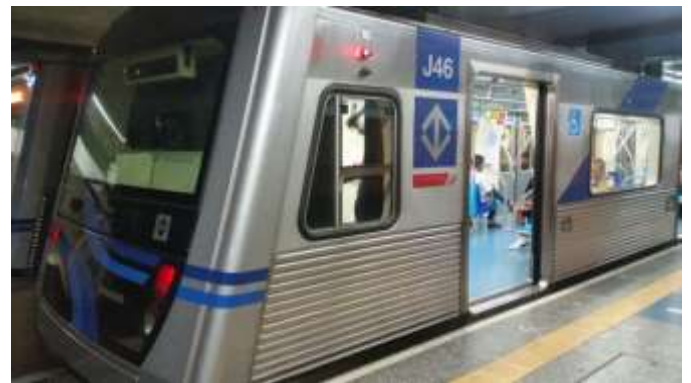
Sistema Metroviário de Transporte

São Paulo, além de oferecer infraestrutura completa de serviços que abrange todos os setores da economia, está capacitada para acolher o público turista. São inúmeros hotéis, bares, cafeterias, restaurantes, padarias, cafés, clubes, casas noturnas, clínicas, hospitais, e extensa rede de estabelecimentos comerciais.