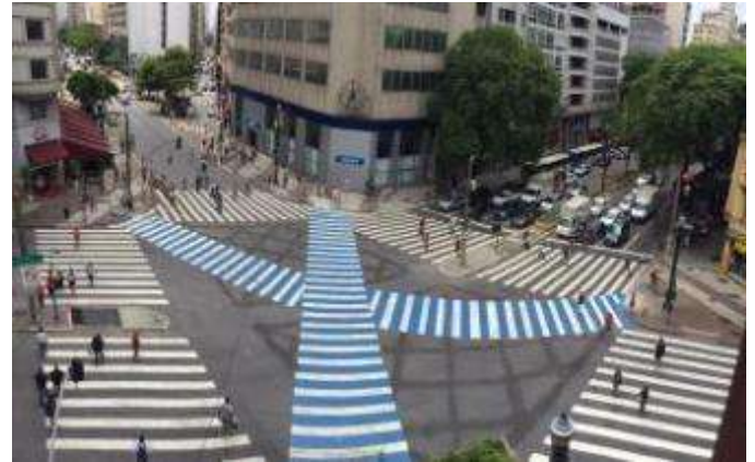
Cruzamento: Avenida Ipiranga e Avenida São João