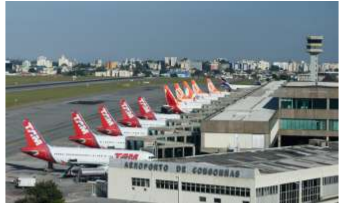
Aeroporto de Congonhas

São Paulo, além de oferecer infraestrutura completa de serviços que abrange todos os setores da economia, está capacitada para acolher o público turista. São inúmeros hotéis, bares, cafeterias, restaurantes, padarias, cafés, clubes, casas noturnas, clínicas, hospitais, e extensa rede de estabelecimentos comerciais.