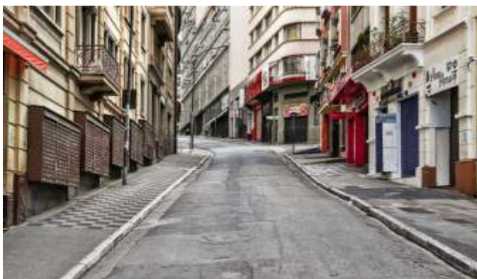
Ladeira Porto Geral – Lockdown (região 25 de Março)

A taxa de ocupação hoteleira acumulou queda de 58,7%. A arrecadação de imposto do setor retraiu 51,1%, equivalente a R$ 193,7 milhões. Consequentemente, houve perda de 18.649 postos formais de trabalho.