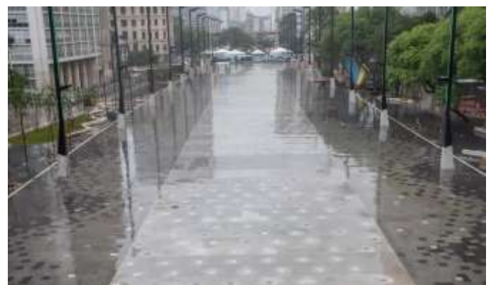
Novo Vale do Anhangabaú

São Paulo tem relevância como destino para estudo, aperfeiçoamento e desenvolvimento de tecnologia.