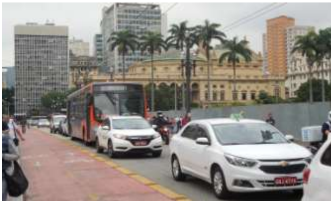
Viaduto do Chá / Teatro Municipal (Transporte urbano)