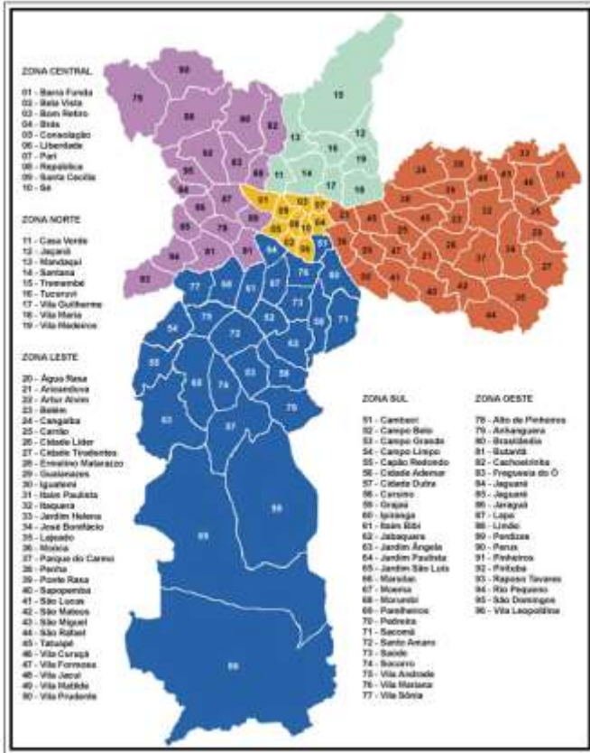
Divisão por Bairros de São Paulo